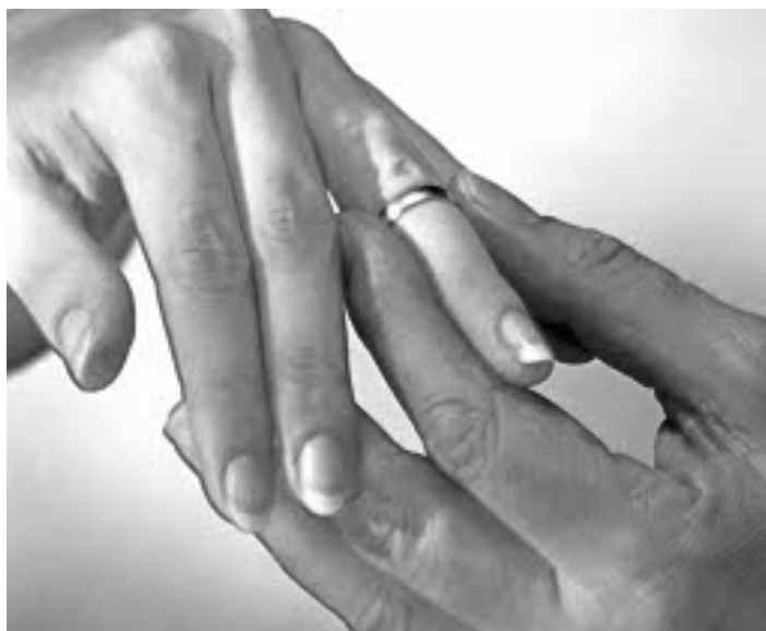
La crisi economica gioca un ruolo di primo piano nel calo dei matrimoni