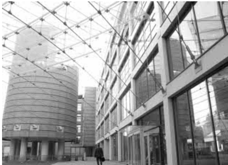
La sede della Banca Popolare di Lodi, dove venerdì si è svolto il vertice sugli esuberanti per il 2011